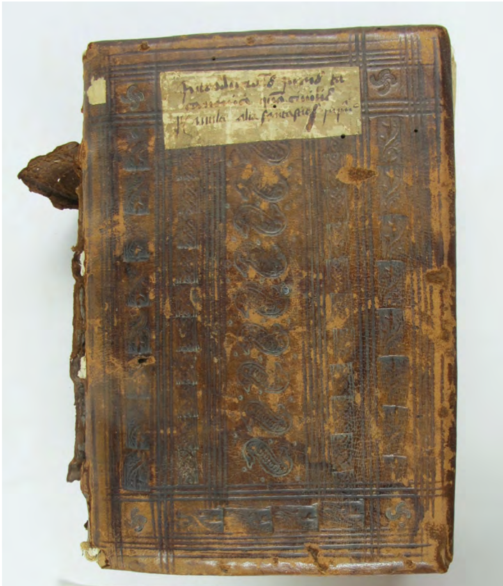
BCCFribourg, Ms 54: Mélanges (XIV e et XV e s.). Papier, 292 feuilles, 22 x 15.7 x 7.5 cm.

Les contributions sont gérées par la Fondation pour la rénovation et la conservation du Couvent des Cordeliers Fribourg et peuvent être déduites des impôts. Les noms des donateurs et donatrices seront mentionnés dans le volume.