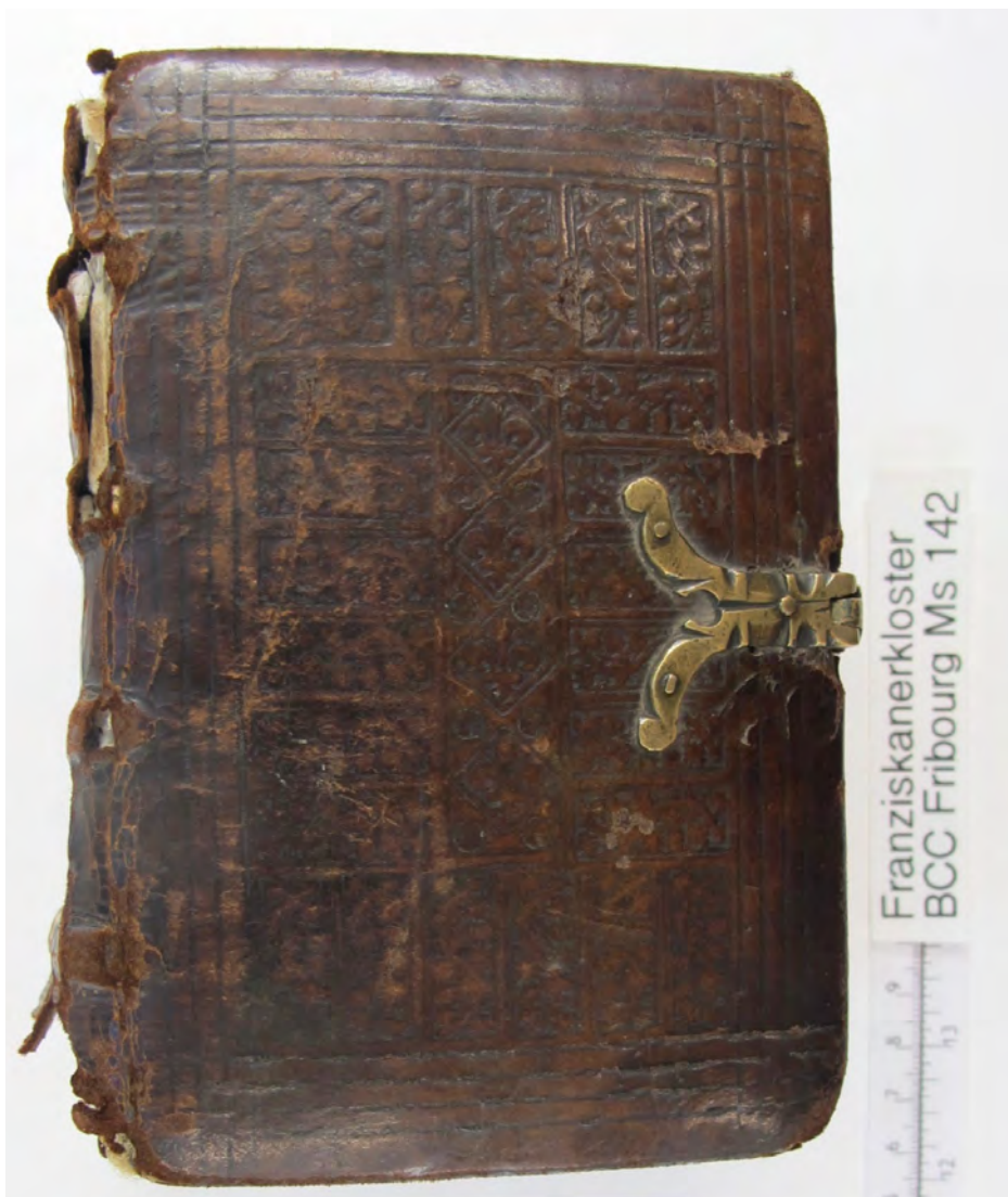
BCCFribourg, Ms 142: Breviarium Fratrum minorum (XIV e s.). Parchemin, 482 feuilles, 14.5 x 10.4 x 9.0 cm.

Les contributions sont gérées par la Fondation pour la rénovation et la conservation du Couvent des Cordeliers Fribourg et peuvent être déduites des impôts. Les noms des donateurs et donatrices seront mentionnés dans le volume.